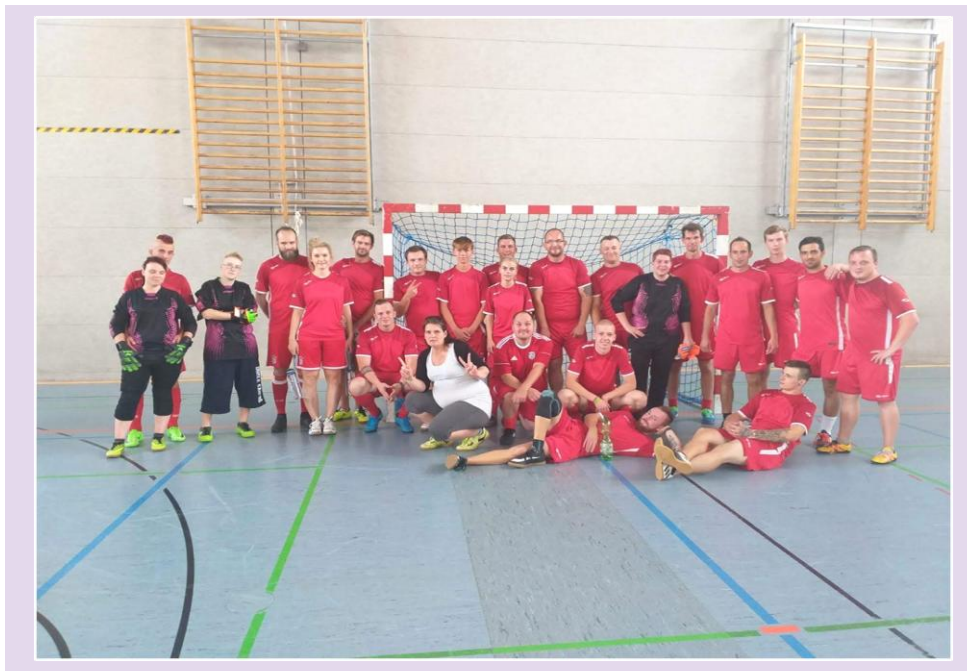
Unsere Mannschaft von Mensch ist der United. Bildmaterial vom August 2019.

Wir trainieren fleißig jeden Donnerstag von 19:00 – 21:00 in der Turnhalle der Torhorst-Gesamtschule, Walther-Bothe-Straße 30, 16515 Oranienburg.